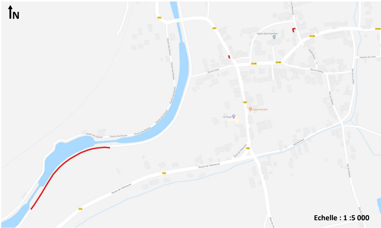
Figure 4 : vue rapprochée du GC 3 sur la commune de Marigny-le-Cahouët