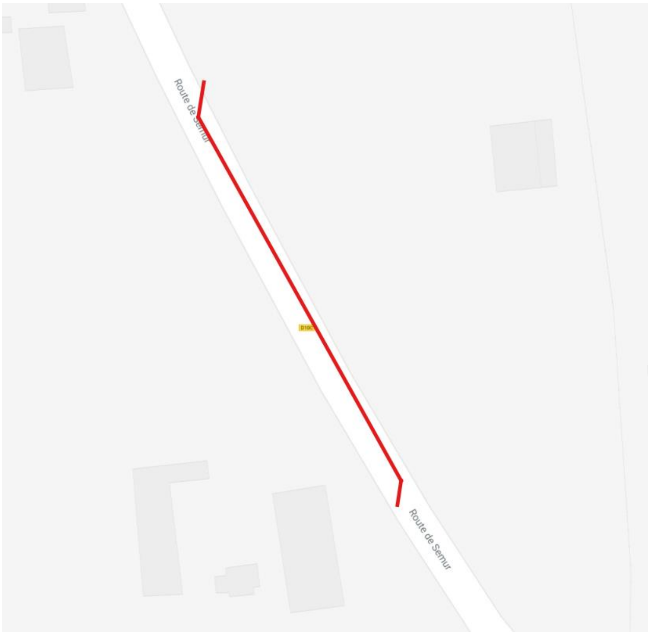
Figure 3 : vue rapprochée du GC 2 sur la commune de Marigny-le-Cahouët