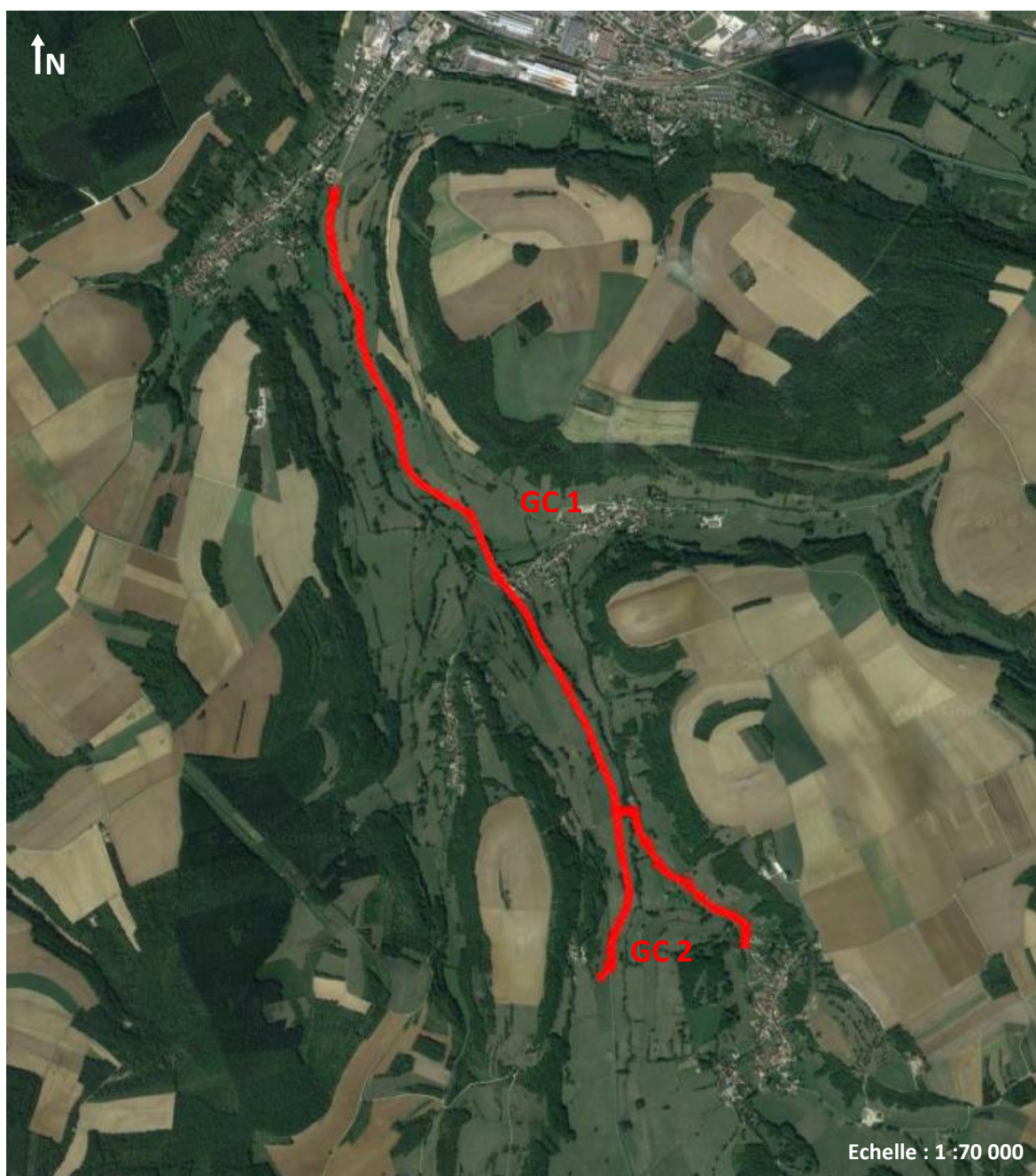
Figure 1: vue d'ensemble du Génie Civil à réaliser entre les communes de Crépand et Montigny-Montfort