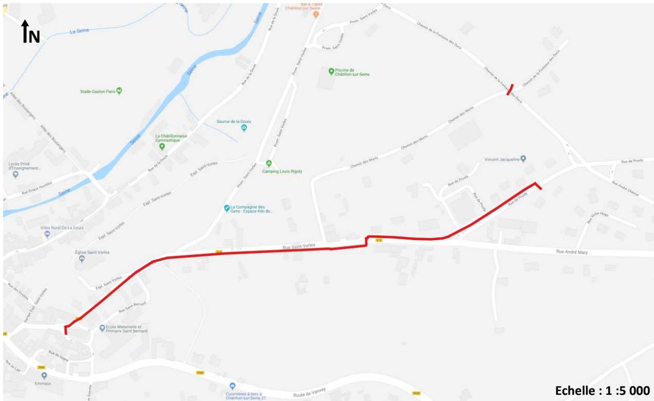
Figure 2 : vue rapprochée du GC 1 sur la commune de Marigny-le-Cahouët