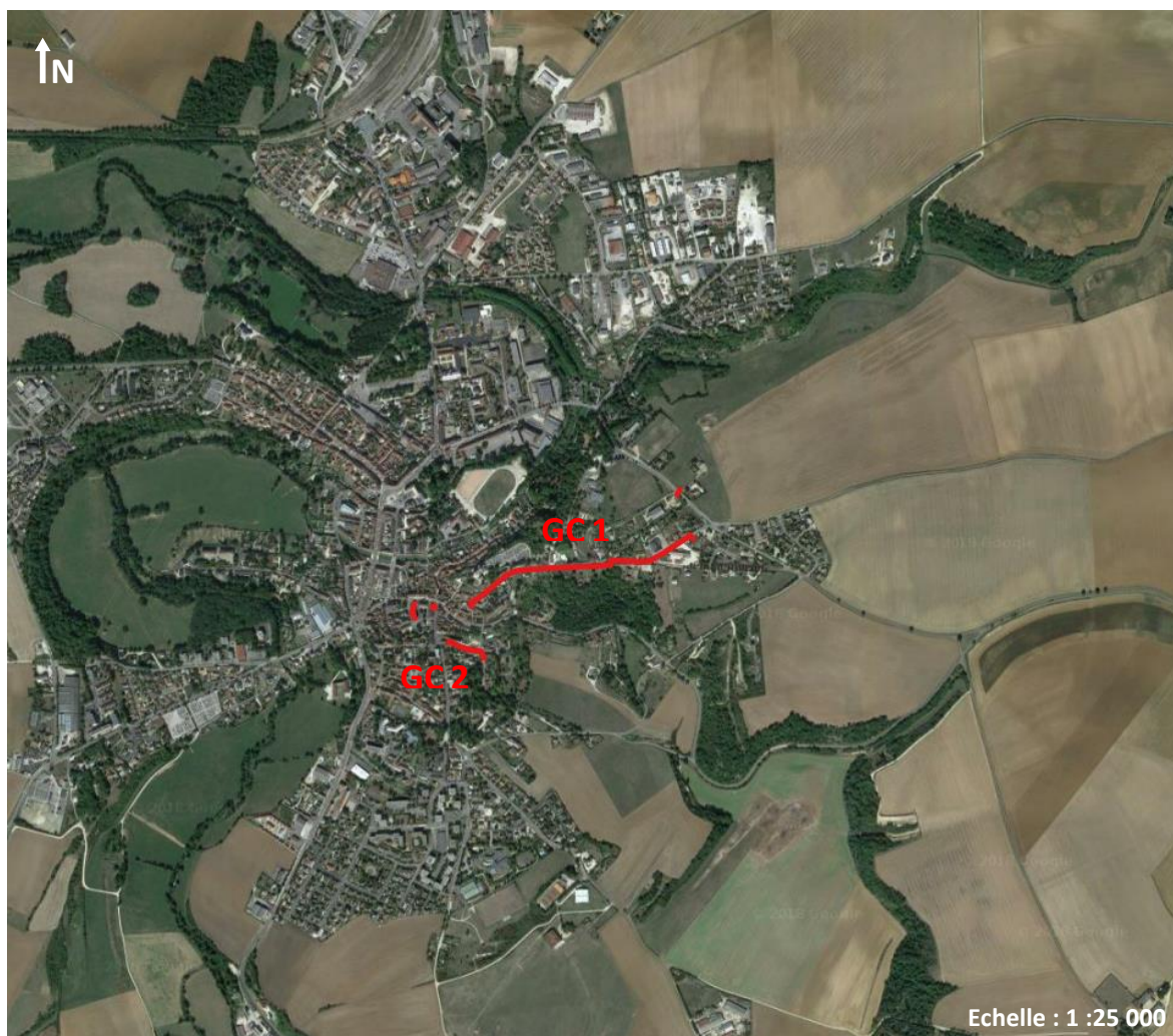
Figure 1: vue d'ensemble du Génie Civil à réaliser sur la commune de Chatillon-sur-Seine